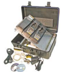
Zubehörsatz für tragbares MicroDock II-System