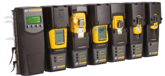
MicroDock II - Wählen Sie jede beliebige Modulkombination mit maximal bis zu sechs Dockingmodulen einschließlich sechs Modulen mit Ladefunktion.

Hinweis: jeder an das System angeschlossene Gaszylinder benötigt einen eigenen Bedarfsflussmengenregler (nicht im Lieferumfang enthalten).